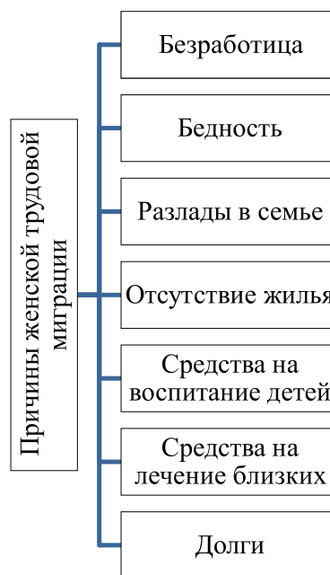
Рис. 1. Причины женской трудовой миграции

во-вторых, в некоторых странах растет благосостояние населения, и домохозяйства в состоянии нанимать на работу домработниц, нянь, кухарок и т.д. Женская миграция – это процесс перемещения женского населения из одних регионов и стран в другие, где есть шанс найти работу. При этом главными причинами женской трудовой миграции являются безработица, бедность, разлады в семье, долги, потребность в средствах на воспитание и обучение детей, отсутствие собственного жилья, потребность в средствах на лечение близких и т.д. Схематически изобразим причины женской трудовой миграции на рис. 1.