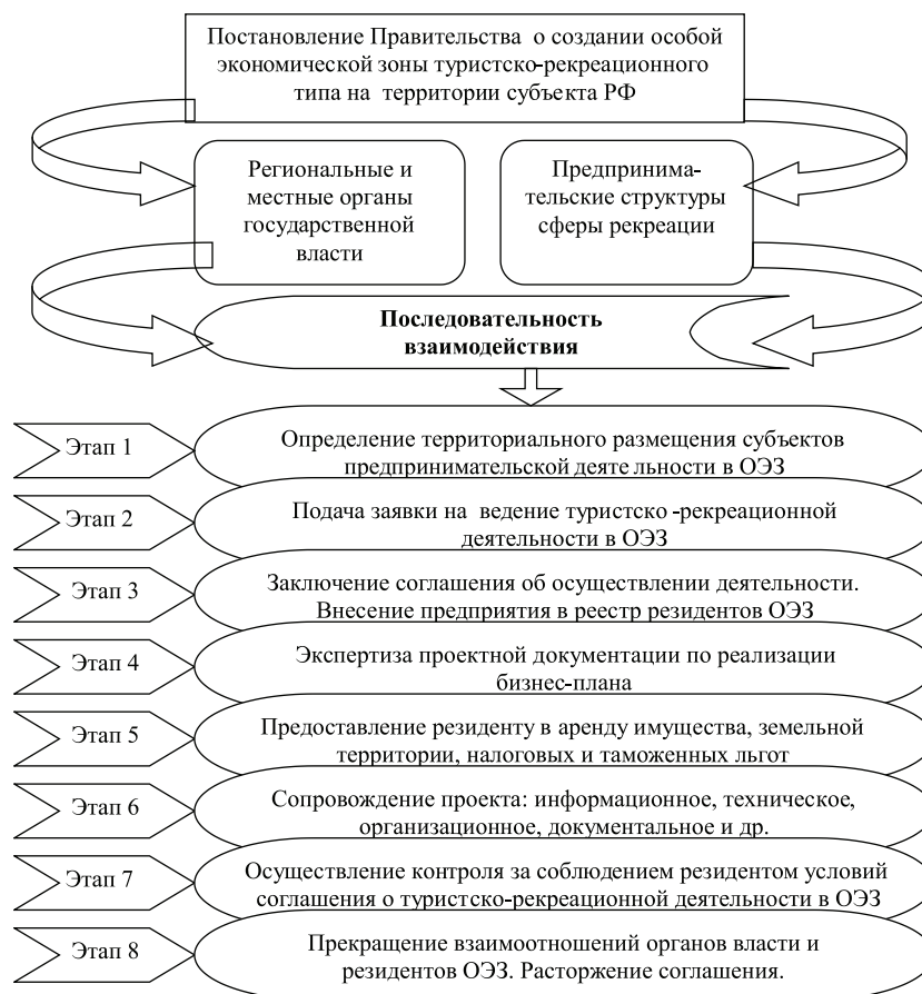
Рис. 2. Система взаимоотношений органов государственной власти и предпринимательских структур при организации ОЭЗ туристско-рекреационного типа

При реализации проекта предполагается создание наблюдательного совета, регулирующего систему отношений участников ОЭЗ туристско-рекреационного типа. В его состав должны войти представители бизнеса, законодательной и исполнительной ветвей власти. Предлагаемая структура наблюдательного совета особой экономической зоны туристско-рекреационного типа в Ставропольском крае может включать: Управление Федерального агентства по туризму, Администрация Кавказских Минеральных Вод, Федеральное агентство по управлению ОЭЗ, Ставропольское отделение российского союза промышленников и предпринимателей, Территориальное подразделение Федерального агентства по управлению федеральным имуществом по СК, Торгово-промышленная палата Ставропольского края, Министерство экономического развития Ставропольского края, предпринимательские структуры – резиденты ОЭЗ.