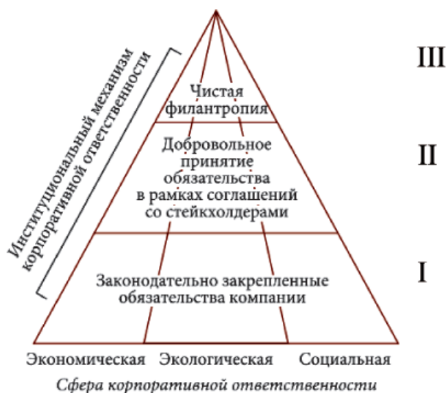
Рис. 1. Институциональная пирамида корпоративной социальной ответственности (составлено А.Г. Поляковой [5])

Итак, корпоративный (локальный) уровень регламентации социальной ответственности относится к второму, наднормативному уровню институциональной модели КСО [5]. Он формируется на основе входящих законодательных и нормативных требований (обязательствах первого уровня модели), а также требований и ожиданий заинтересованных сторон.