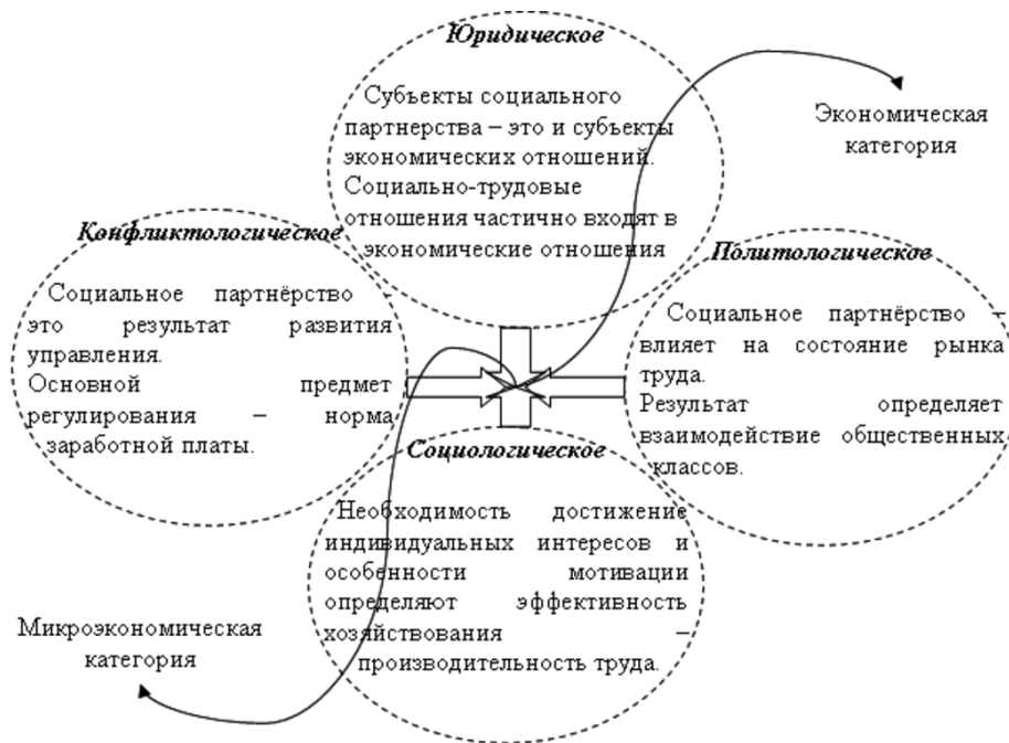
Рис. 1. Модель применения междисциплинарного подхода при уточнении теоретического представления о социально-трудовом партнёрстве как экономической категории

Социально-трудовое партнёрство можно понимать как экономическую и как микроэкономическую категории. В первом случае она подразумевает взаимодействие субъектов экономических отношений в процессе перехода рынка труда в различные состояния, определяющие динамику изменения нормы заработной платы и производительности труда и, соответственно, влияющие на уровень безработицы-занятости, специфику рабочей силы и качество жизни населения.